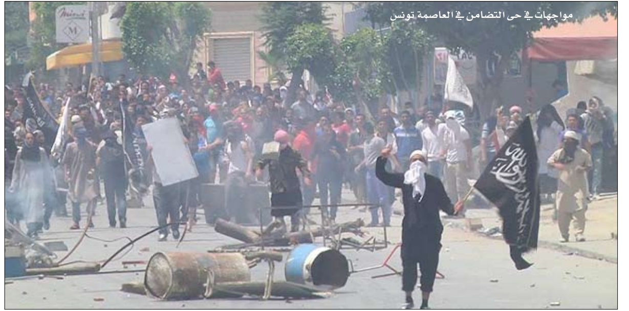
مواجهات في حي التضامن في العاصمة تونس