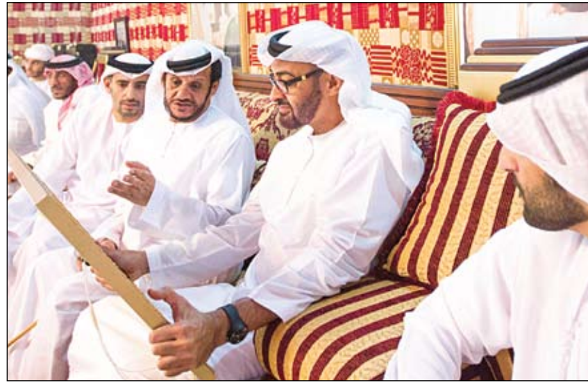
محمد بن زايد خلال حضوره مأدبة الغداء التي أقامها تكريماً لسموه مظفر خموشه العامري

استجابة لما نشرته الفجر التربية تسارع بتحديث المسميات الوظيفية في نظام بياناتي وفق الهيكل الجديد للمناطق دبي - محسن راشد استجابة لما نشرته جريدة الفجر الثلاثاء الماضي 14 مايو الجاري ، تحت عنوان نظام بياناتي يتن من كم المسئولين بهيكل المناطق... الأقسام 4 والرؤساء بلا حساب منتقدة وزارة التربية والتعليم لإطلاقها الهيكل التنظيمي للمناطق التعليمية قبل عامين ، يتضمن 4 أقسام فقط بعدما كان بالهيكل السابق 9 أقسام ، إلا أنها أبقى وحتى نشر الخبر على مسميات رؤساء الأقسام في الهيكل السابق بنظام بياناتي الخاص بالموارد البشرية ، فبات نظام بياناتي يضم 13 رئيس قسم 4 جدد تم تسكينهم وفق الهيكل الجديد ، و 9 تم الإبقاء عليهم كرؤساء أقسام وفق الهيكل السابق . واستجابة لما تم نشره بال الفجر بادرت وزارة التربية والتعليم ووجه سعادة مروان الصوالح وكيل وزارة التربية والتعليم المساعد لقطاع الخدمات المساندة ، كتابا برقم 388 نهاية الأسبوع الماضي ، إلى كافة المناطق التعليمية بالدولة يؤكد عليها فيه بالعمل والتنسيق فيما بينهما ، على تحديث البيانات وفق المسميات الوظيفية الجديدة للوظائف القيادية بالمناطق التعليمية . (التفاصيل ص5) الزمرة يكشف قصة المؤامرة الإخوانية على الإمارات دبي - أبو ظبي - وام أطلق مركز الزمارة للدراسات والبحوث العدد الرابع من سلسلة جذور التآمر ضد الإمارات تحت عنوان قصة المؤامرة الإخوانية على الإمارات.. من تسلسل الفكر إلى فشل المخطط ومحكمة المتهمين وهو الكتاب الأول