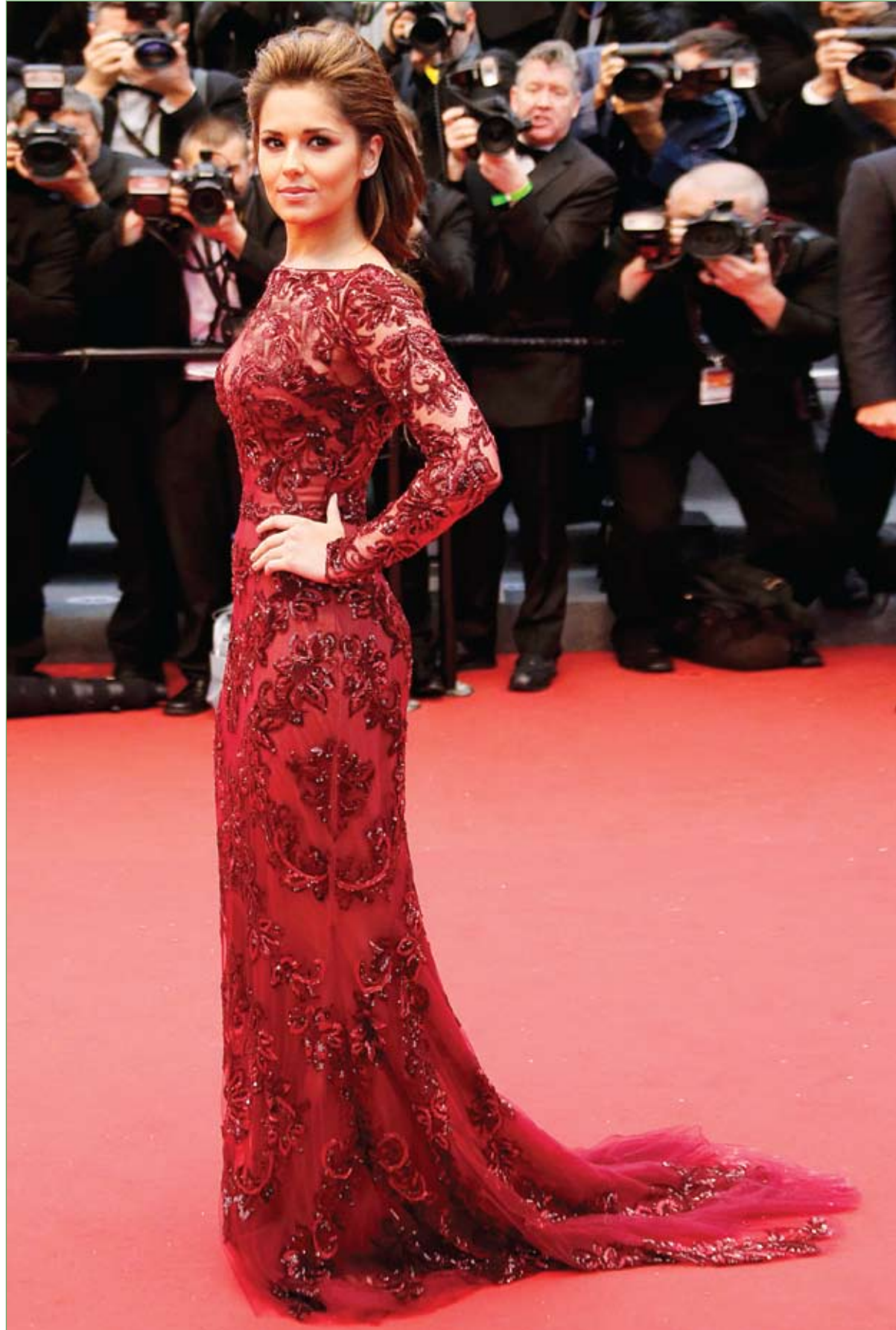
الغنية شيريل كول لدى وصولها على السجادة الحمراء لحضور عرض الفيلم (جيمي P) في مهرجان كان السينمائي.

وحتى لو كان الشخص يريد زيادة مأخوذه من البوتاسيوم عن طريق الغذاء فقط وليس المكملات، فيجب أن يراجع أخصائي الرعاية الصحية الذي سيقوم حالته ويوصي باللائم.