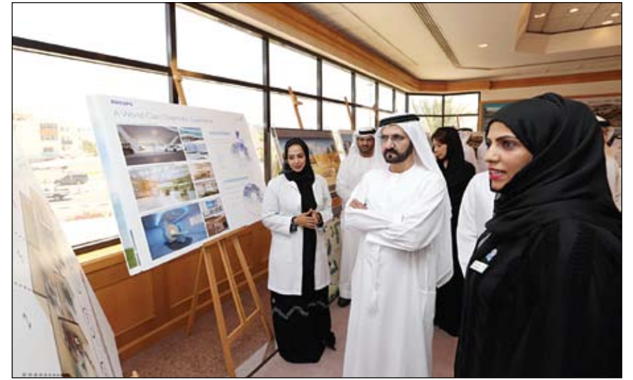
محمد بن راشد يطالع على عدد من مشاريع هيئة الصحة في دبي

دبي - أبو ظبي - وام أصدر الفريق أول سمو الشيخ محمد بن زايد آل نهيان ولي عهد أبوظبي نائب القائد الأعلى للقوات المسلحة رئيس المجلس التنفيذي قراراً بتكليف سعادة سيف بدر القبيسي بهام مدير عام هيئة أبوظبي للإسكان. من جهة أخرى حضر الفريق أول سمو الشيخ محمد بن زايد آل نهيان ولي عهد أبوظبي نائب